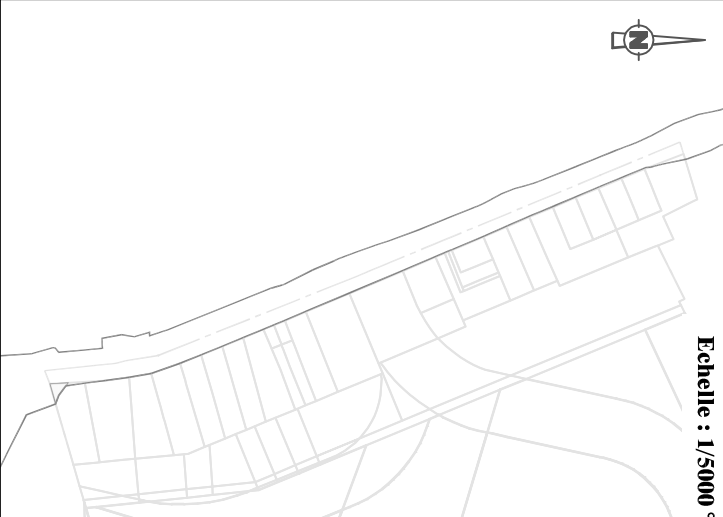
Plan du lot : Echelle 1/500°